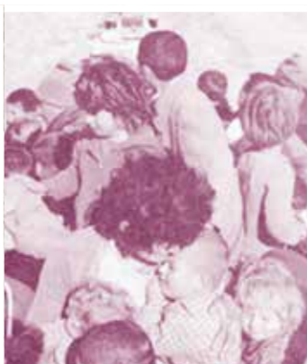
1964-1974. Ε/κ και Τ/κ πρόσφυγες και συγγενείς αγνοούμενων